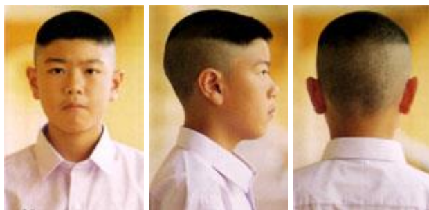
ทรงผมนักเรียน มัธยมศึกษาตอนต้น

นักเรียนระดับชั้นมัธยมศึกษาตอนต้นตัดสั้นทรงนักเรียน ด้านข้างและด้านหลังตัดเกรียน ด้านบนตัดสั้นรองหวี ผมด้านหน้ายาวไม่เกิน 4 เซนติเมตร