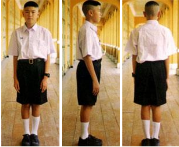
เครื่องแบบนักเรียน ระดับชั้นมัธยมศึกษาตอนต้น