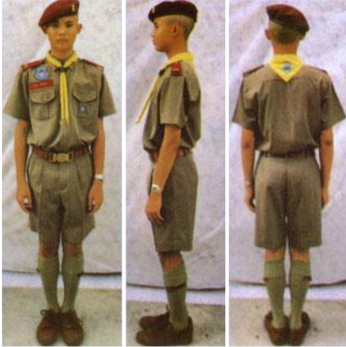
เครื่องแบบลูกเสือสามัญรุ่นใหญ่ ระดับชั้นมัธยมศึกษา ตอนต้น