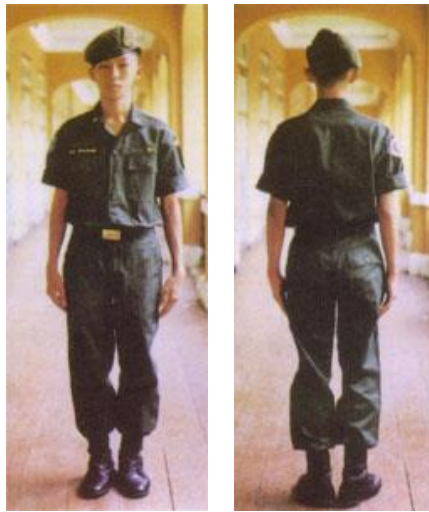
เครื่องแบบนักศึกษาวิชาทหาร ระดับชั้นมัธยมศึกษาตอนปลาย